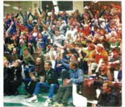
La soirée de remise des trophées des "Piolets d'or jeunes" a eu lieu samedi à l'amphithéâtre de l'Ensa.