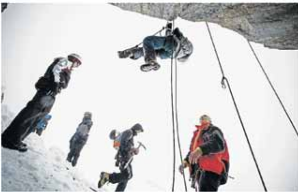
Sur le plateau de l'aiguille du Midi, atelier de remise en état sur corde fixe, le 22 mai.

Depuis 2010, l'association Groupe de haute montagne permet à des jeunes de la France entière de découvrir l'escalade sur des sites de Haute-Savoie